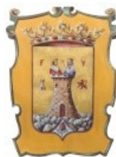
Ayuntamiento de Montefrío