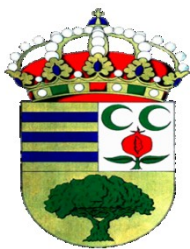
Ayuntamiento de Ogijares