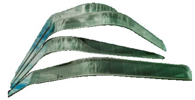
Distrito Sanitario de Atención Primaria Granada Metropolitano