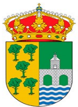
AYUNTAMIENTO DE PINOS PUENTE Todo un Descubrimiento