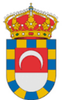
Huétor Tájar Ayuntamiento