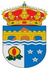
AYUNTAMIENTO DE DÚRCAL